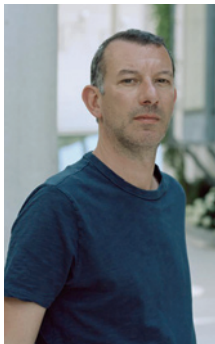
C. MARTINEZ