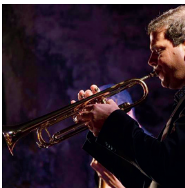
GEOFFROY TAMISIER © DR