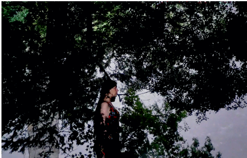
DISCOURS AUX VÉGÉTAUX – COSIMA WEITER