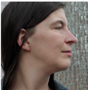
C. WEITER © A. SIMON