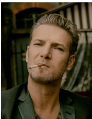
B. BELIN