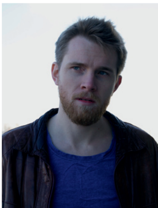
EMANUEL CAMPO