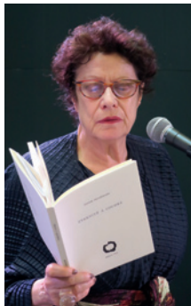
E. TELLERMANN © MARCHÉ DE LA POÉSIE

MARDI 12 OCTOBRE, 19H30 PASSAGE SAINTE-CROIX