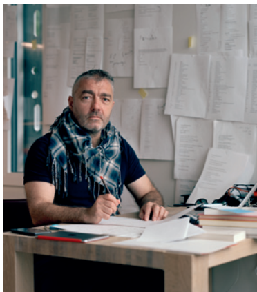
F. DUMOND © M. HAREL VIVIER

Pour cette sortie de résidence, l'auteur et les participants imaginent une lecture polyphonique et multilingue pluriforme qui relie les fragments de vie, la diversité des parcours et les légendes culturelles de chacun et met en avant la beauté même des langues.