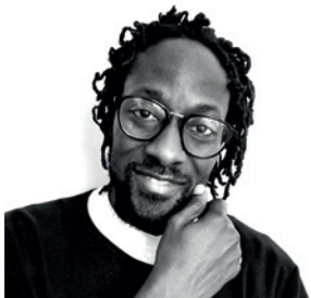
NII AYIKWEI PARKES