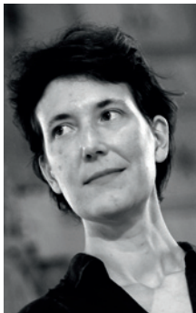
L. TAÏEB