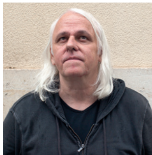
A. SIMON © L. SIMON