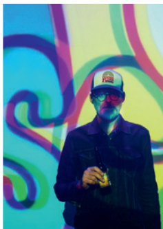
R. STEINER