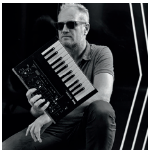
G. HAZEBROUCK © RBK RECORDS

SAMEDI 16 OCTOBRE, 18H30, LE LIEU UNIQUE